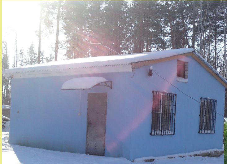
Домик для персонала